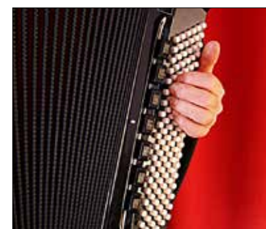
Les instruments à bretelles se feront entendre dimanche.

Le concert de soutien du CAT sera donné dimanche à 17 heures à l'église des Breuleux. L'entrée sera libre, avec collecte au profit de Potentiel et de l'ADSR à la fin de la représentation. LFM/sfr