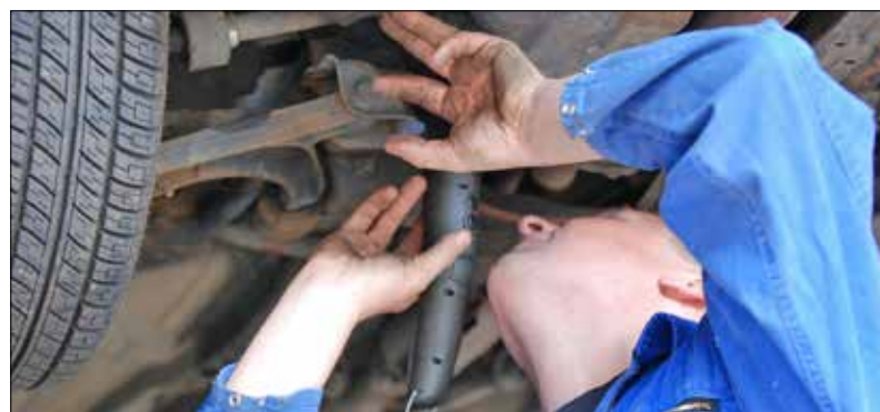
Le parti socialiste jurassien aimerait connaître les solutions proposées par le Gouvernement pour résorber le retard accumulé par l'OVJ.

Au lendemain des résultats du scrutin, le gouvernement prenait acte