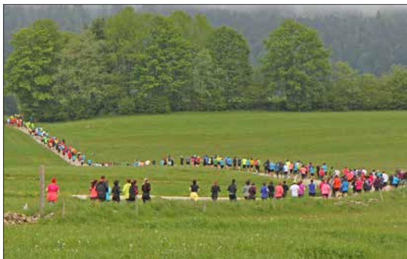
Un cortège coloré de sportifs émérites a fleuri les champs du Noirmont vendredi lors de la dixième édition de la Course des Franches.

Réduction du temps d'attente en cuisine, ravitaillement, balisage méticuleux, chronométrage précis, contrôles rigoureux, photo finish, tout est mis en œuvre pour que le concurrent soit dans sa course. «C'est indispensable, les